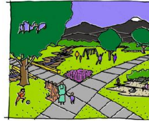
Foto de un parque

Cliente. Esta es la persona o entidad dueña del sitio, que tiene derecho legal para utilizar el sitio, o está buscando un sitio donde poder situar un proyecto de desarrollo. El cliente está buscando una o más entidades que le ayuden con el diseño y la construcción del proyecto. El cliente puede tener experiencia con proyectos de desarrollo, o ésta puede ser una nueva empresa creada para él. Puede tener algo de experiencia y estar buscando asistencia adicional, o pueda que no tenga conocimiento acerca de cuestiones de desarrollo. El cliente tiene una idea en cuanto a lo que quiere construir en el sitio, conocido comúnmente como el programa. En la región, el cliente puede ser una ONG, una entidad gubernamental o un propietario privado, por ejemplo.