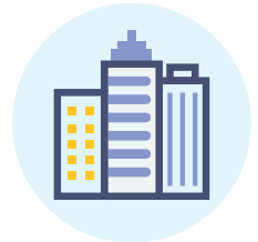
Tính cách có sẵn