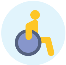
Tính cách dễ ra vào

Quận LA sẽ thực hiện một cuộc phân tích không gian toàn diện để hiểu khi nào và nơi đâu cử tri có nhiều khả năng đi bầu nhất.