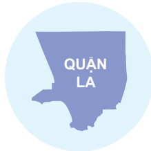
Khoảng cách gần